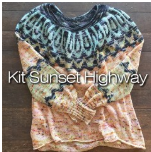
Kit Sunset Highway